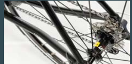
Der Hinterbau des Desert Falcon Pro ist leicht eingeknickt.