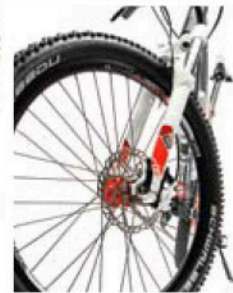
Top Federgabel und super Scheibenbremse