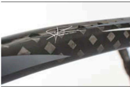
Der Name Pinarello steht für hohe Qualität.