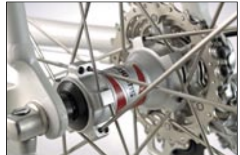
Feine Technik von Shimano: Der Laufradsatz WH-RS10.

Anders als im Vorjahr ist allerdings das Finish des Rahmens. Die weiße Lackierung steht dem Desert Falcon gut zu Gesicht und verleiht ihm im Zusammenspiel mit den flotten Appliken einen frischen Auftritt. Aufgetragen wurde der Lack auf Rohre aus einer 6061-Aluminiumlegierung, die per gelungenen Schweißnähten vereint und an diesen „Schwachpunkten“ dreifach konifiziert wurden.