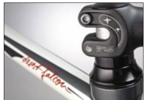
Der kräftige ITM-Vorbau umschließt sicher den Aluschaft der Gabel.

Mehr als nur in Ordnung ist die Ausrüstung, die am Desert Falcon für die 1 000-Euro-Klasse verbaut wurde: eine komplette Ultegra mit niegelagelten Laufrädern namens WH-RS10 ebenfalls von Shimano und soliden Bauteilen von ITM. Das ist eine Ansage, bei der kein anderer Hersteller Kontra geben kann. Unter www.radsport-rennrad.de finden Sie eine Liste mit allen angeschlossenen Radhändlern in Deutschland.