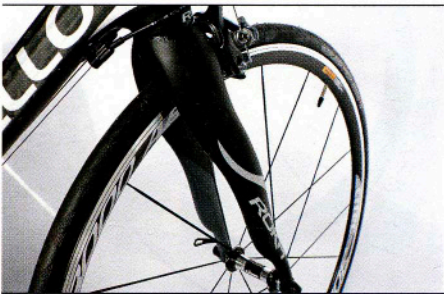
Das Markenzeichen des Rahmensets ist die Onda Gabel.