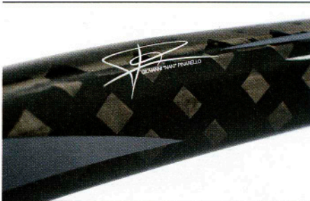
Der Name Pinarello steht für hohe Qualität.